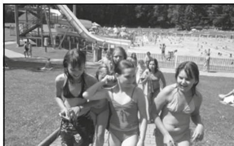
Koupaliště ve Skutči – oblíbený cíl celodenních výletů