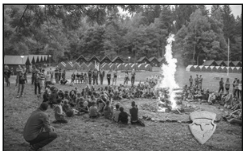
Na táboře nesmí chybět slavnostní oheň se zpíváním a kytarami