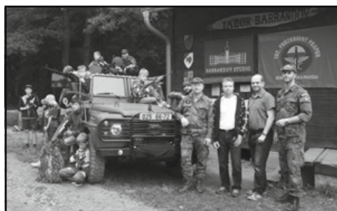
Copak je to za vojáka? No přeci kamarádi ze 102. průzkumného praporu z Prostějova