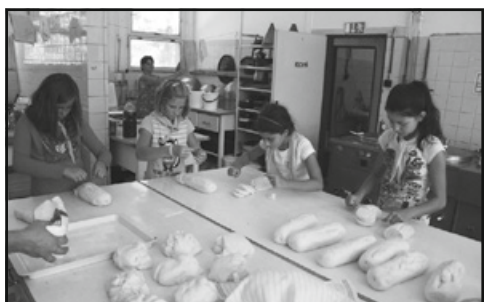
Čerstvé chutné jídlo připravujeme pětkrát denně