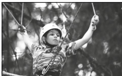
Lanové centrum v korunách stromů