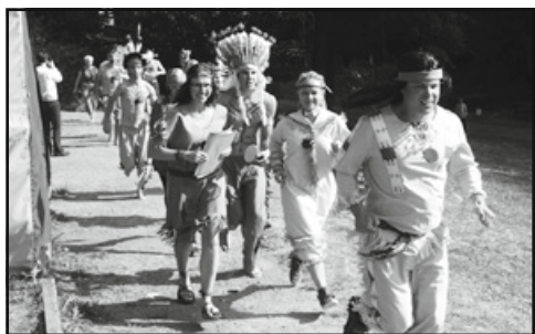
Celý tábor protíná jako zlatá nit celotáborová etapová hra